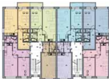
BYTOVÝ DOM 2