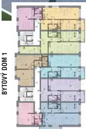
BYTOVÝ DOM 1