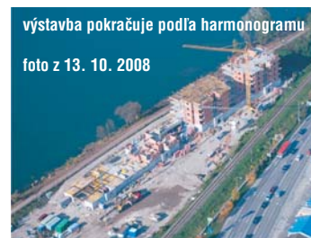
foto z 13. 10. 2008